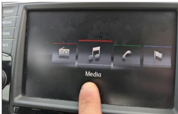
3. Selecteer media