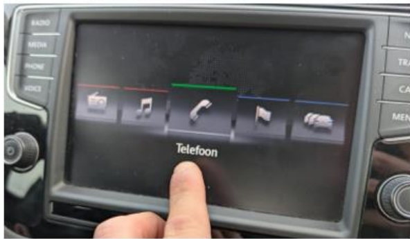
1. Selecteer telefoon