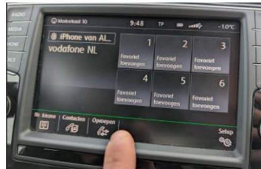
2. Controleer de verbinding of koppel