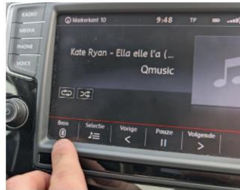
4. Controleer de verbinding en klik op bron